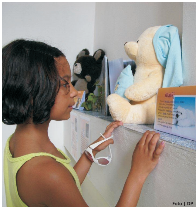
Originální výstava medvídků je k vidění na pobočce v Jungmannově ulici.