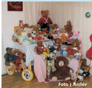
Zámek hostí stovky medvědů.

Zlaté Hory • Mistrovství světa v rýžování zlata proběhne od 16. do 22. srpna ve Zlatých Horách. Tradiční klání zlatokopů, a to mužů, žen i dětí, doprovodí bohatý kulturní program, ve kterém nebudou chybět pistolnické přestřelky a country hudba. Tradice rýžování zlata vznikla před 16 lety a je spjata se soutěží o putovní zlatou pánev starosty města. Každý vítěz ji podle pravidel dostane na jeden rok a poté musí své prvenství obhájit. | DP