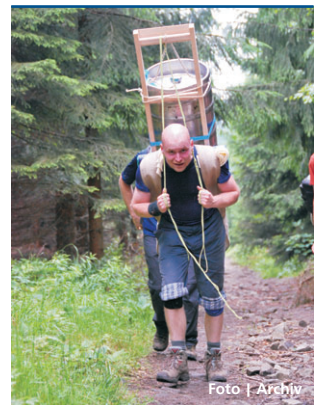
Soutěžící prověří své síly.

Výstavu techniky a nástrojů zkomponovanou ze sbírek všech pracovišť Vlastivědného muzea v Šumperku doplní nabídka komentovaných prohlídek a dílen zaměřených na zhotovování fotografií klasickou mokrou cestou. | DP