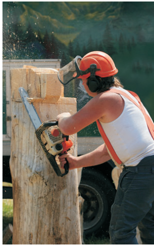
Zlaté ruce umělců podpoří onkologicky nemocné děti.

Vlaské • V panenské přírodě podhůří Jeseníků se od 12. do 17. července setkají milovníci umění a dobré zábavy. V Chalupě Pod Sviní horou se v těchto dnech uskuteční pod širým nebem první ročník uměleckého festivalu Zlaté ruce 2010.